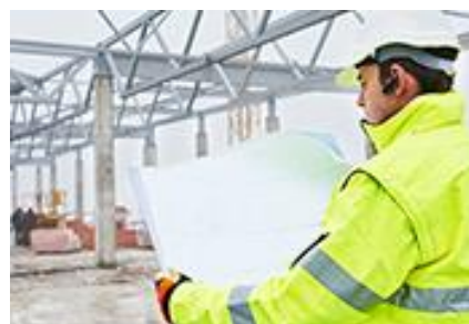
建設会社・工務店